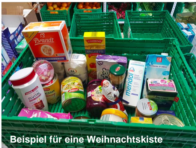
Beispiel für eine Weihnachtskiste

Hier nun genauere Angaben zu den Kisten: Packt eine Kiste mit haltbaren Lebensmitteln (keine frischen Lebensmittel!) wie Zucker, Mehl, Nudeln, Reis, Öl, Konserven, etwas Süßem für die Kinder wie Schokolade oder dergleichen. Das Mindesthaltbarkeitsdatum darf nicht überschritten sein und sollte auch noch eine Weile Bestand haben. Bitte verschließt die Lebensmittelkiste nicht, damit die Mitarbeiter der Tafel sehen können, ob sich die Lebensmittel für Familien mit Kindern, für ältere Menschen, für Migranten oder für alleinstehende Personen eignen. Es können auch Kosmetikartikel oder Waschmittel eingepackt werden, natürlich unbenutzt und verpackt. Wer möchte, kann auch ein kleines Spiel (z.B. Kartenspiel o.ä.) für Familien mit Kindern einpacken. In den einzelnen Klassen kann man dann gemeinsam überlegen, für wen eine Kiste gepackt werden soll und wer was dazu beiträgt.